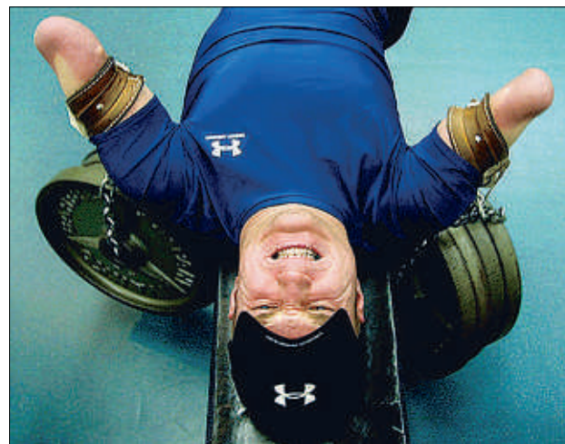
Kyle Maynard, un ejemplo de superación, una historia increíble que él mismo ha narrado en un libro autobiográfico titulado 'Sin excusas'